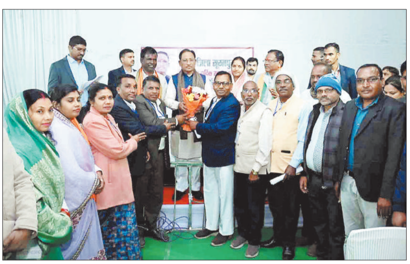
मुख्यमंत्री का स्वागत करते जनप्रतिनिधि एवं अधिकारी।